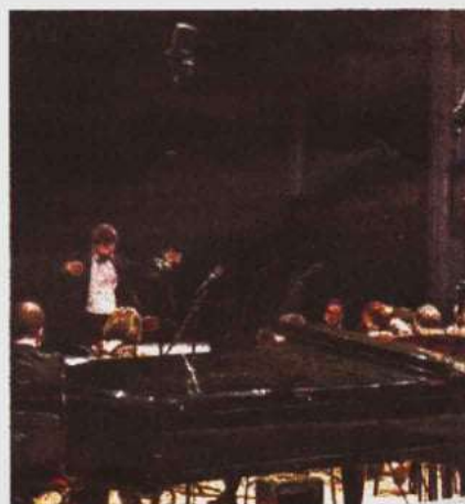
Teatro Rendano Un momento del concerto di Natale