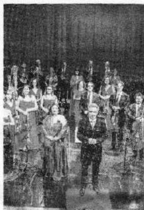
La Filarmonica Pugliese Stasera chiuderà il Festival