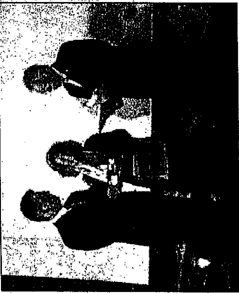
La consegna del mantello d'oro al sindaco di Lampedusa

successo della manifestazione si spiega attraverso l'analisi di due fatti essenziali. La gente e le istituzioni si sono riconosciute nei grandi valori che, nel nome di Frate Francesco, ci sforzavamo di perseguire e di valorizzare. A ciò si aggiunge la qualità delle scelte espresse nell'assegnazione dei premi. Abbiamo rispettato, infatti, in termini di trasparenza, il patto di lealtà che deve intercorrere tra una istituzione come il Rotary Club e l'opinione pubblica. I cittadini lo hanno capito e ci hanno onorato del proprio consenso».