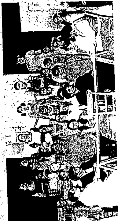
Un momento della manifestazione

che dai comuni limitrofi. Un pubblico degno dei cartelloni dei più importanti teatri italiani. Uno spettacolo che